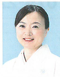
望月麻衣(もちつき・まい)

京都市生まれ。同志社大学大学院修士課程修了。出版社勤務を経て、2006年『いやしい鳥』(文藝春秋)で文学界新人賞受賞。13年『爪と目』(新潮社)で第149回芥川賞受賞。同年、京都市文化芸術表彰(きらめき賞)を受賞。14年『おはなして子ちゃん』(講談社)で第2回フラウ文芸大賞受賞。16年京都市文化賞奨励賞受賞、17年短編集『ドレス』(河出書房新社)を出版。