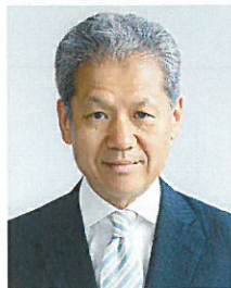
大垣守弘(おおがき・もりひろ)

北海道出身。2013年から京都に移り住む。同年、インターネットの小説投稿サイト「エブリスタ」で第2回電子書籍大賞を受賞。主婦の友社にて書籍デビューを果たす。『京都寺町三条のホームズ』(双葉文庫)が16年度の第4回京都本大賞を受賞し、漫画化、テレビアニメ化される。近著に、『わが家は祇園の拝み屋さん』(角川文庫)、『京洛の森のアリス』(文春文庫)、『太楽荘ダイアリー』(双葉文庫)など。