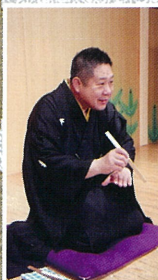
しょうふくていがっこ